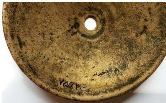
تصویر ۲. پشت دیسک مفرغی اورارتویی دهنه اسب موزه آذربایجان شرقی.