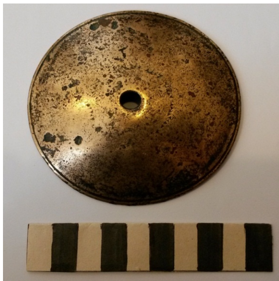
تصویر ۱. روی دیسک مفرغی اورارتویی دهنه اسب موزه آذربایجان شرقی.