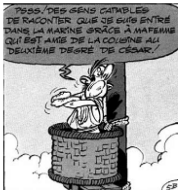
شکل ۲ علائم خشم: دهان محکم بسته‌شده، چشمان بسته، دستان به هم قفل شده و نزدیک بدن