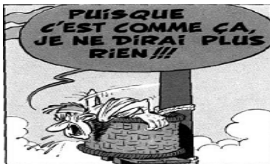
شکل ۱ علائم خشم: چشمان باز و از حدقه درآمده، دهان باز

احتمالاً در کارتونها دیده‌اید که سر فرد خشمگین قرمز می‌شود و به اطراف می‌چرخد، انگار فرد خشمگین برای کاهش خشم خود سرش را به این ور و آن ور می‌چرخاند.