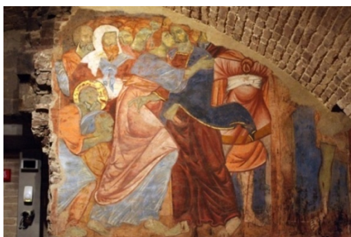
تصویر شماره ۵