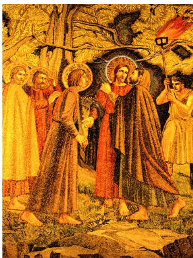
تصویر شماره ۶