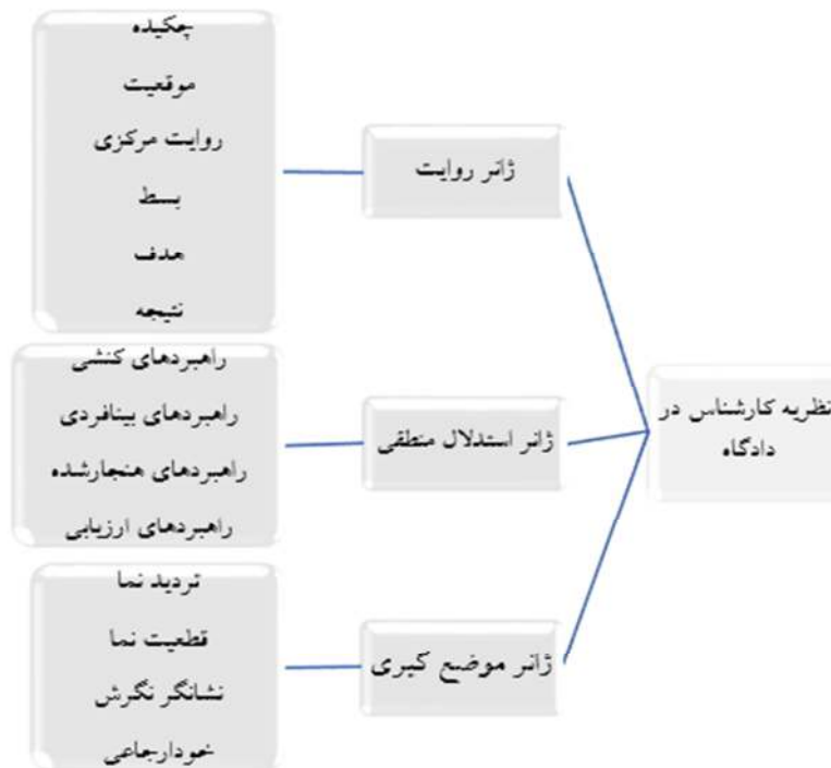
شکل ۴. چهارچوب پیشنهادی گفتمان نظریه کارشناسی در دادگاه

بر اساس مطالب مذکور نویسندگان مولفه‌های تشکیل دهنده گفتمان «نظریه کارشناسی در دادگاه» را به صورت شکل (۳) ارائه می‌دهند: