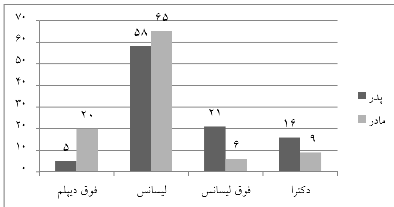
نمودار ۲. درصد تحصیلات والدین در طبقه بالا

ملاک بعدی برای تعیین طبقه اجتماعی شغل والدین است که در این ملاک مشاغل به پنج گروه تقسیم شده‌اند: دولتی، غیردولتی، خدماتی، دانشگاهی و خانه‌دار (جدول ۳). در طبقه بالا بیشترین درصد اشتغال والدین در مراکز دولتی و در طبقه پایین بیشترین درصد اشتغال پدران در مشاغل خدماتی مانند کارگر شهرداری، بنا، لوله‌کش، راننده و ... است. هم‌چنین با مقایسه زنان خانه‌دار در هر دو طبقه متوجه می‌شویم که درصد مادران خانه‌دار در طبقه متوسط بالا ۲۶ درصد است (در مقایسه با وجود ۵۵ درصد مادر خانه‌دار در طبقه پایین) (جدول ۳).